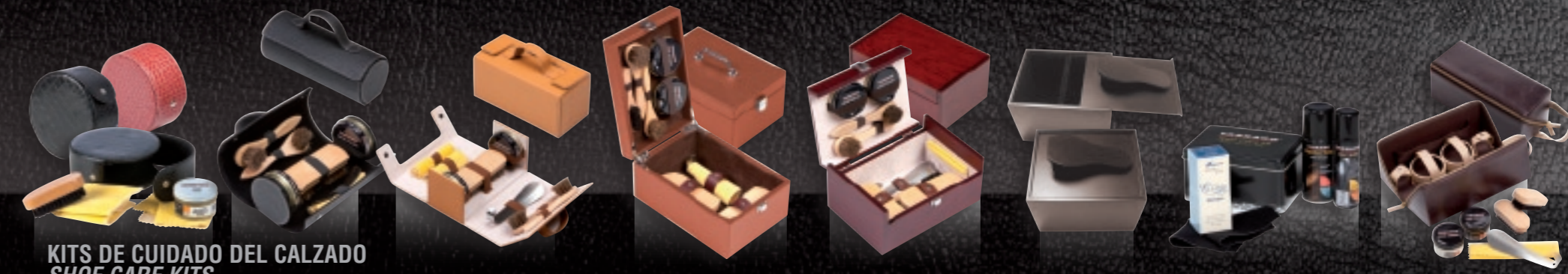
KITS DE CUIDADO DEL CALZADO SHOE CARE KITS