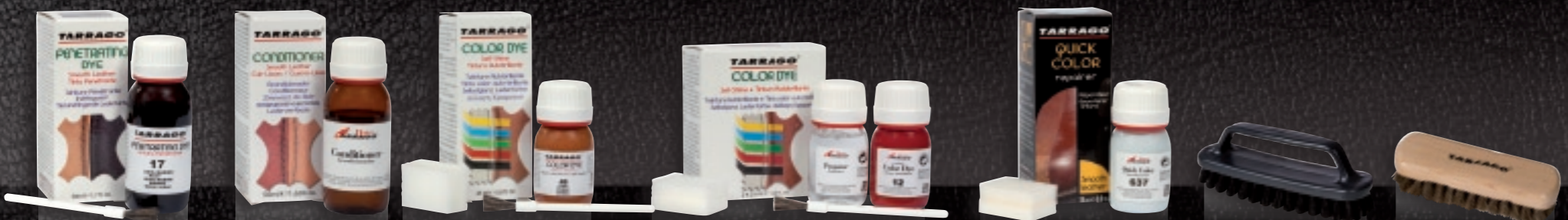
TEÑIR Cambiar el color DYE Change the color