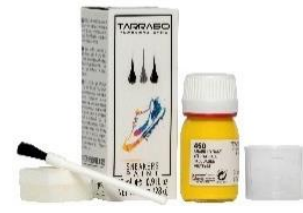
Colores para mezclas